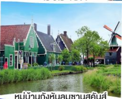
หมู่บ้านกังหันลมซานสคินส์