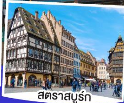
สตราสบูร์ก